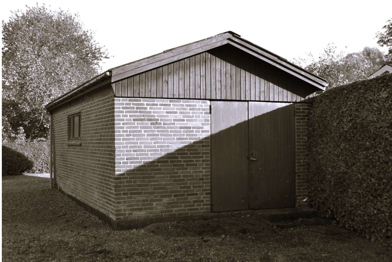
Frysehuset i Mejlby, beliggende ved siden af byens forsamlingshus.

Også Mejlby har haft sit eget frysehus, men på arkivet har vi intet materiale om det.