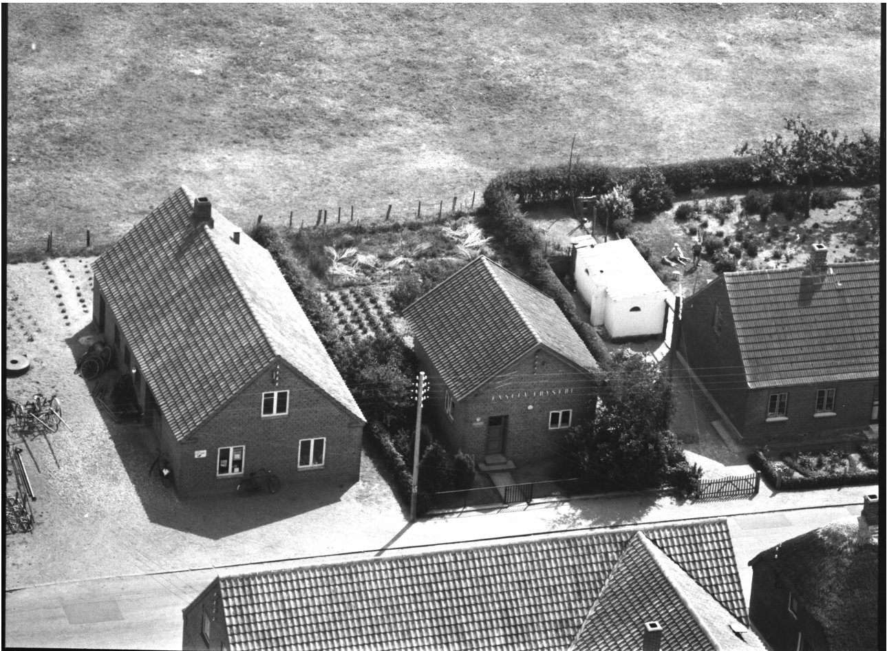
"Enslev Fryseri" stod der på gavlen. Det lå på Krogagervej, her lige midt i billedet.