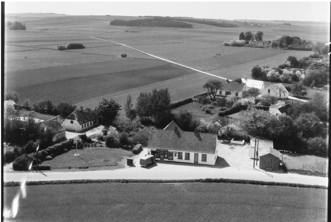
Frysehuset i Blenstrup til højre i billedet, med gavlen ud mod vejen, fotograferet i 1963.